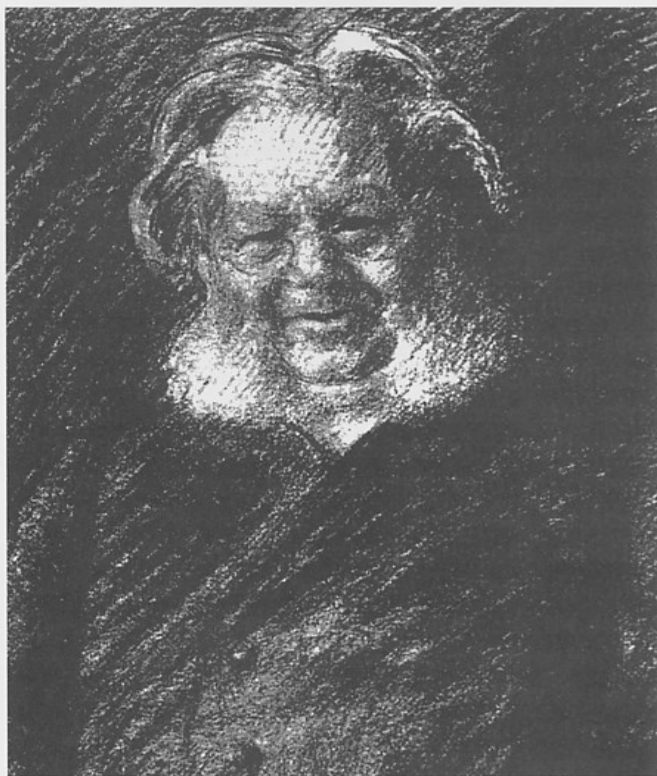
Henrik Ibsen. Tegning av Erik Werenskiold 1895

For å gi lærere som er i arbeid mulighet til å benytte dette studietilbudet, blir Norsk 2 lagt til samlinger (torsdag, fredag, lørdag) annethvert studieår. Slik er det i inneværende studieår ved vår høgskole. Det er åtte samlinger i alt, hver med 18 undervisningstimer. Undervisninga blir på denne måten svært komprimert, og det blir liten tid til å drive gruppeaktiviteter under samlingene.