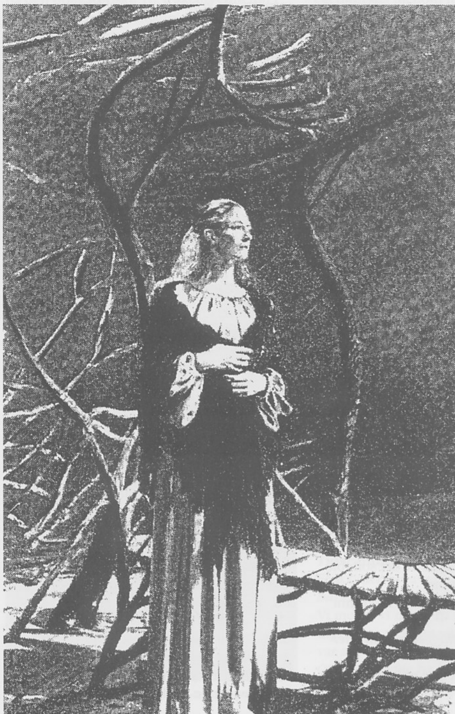
Vanessa Redgrave som Ellida Wangel. Circle-in-the-Square Theatre, New York, 1976. Regi: Tony Richardson.

Det var tydelig at studentene nå hadde arbeidet bevisst med virkemidler de hadde lært å bruke i dialogbiten. Kroppsspråket ble sterkt framhevet. De var også flinke til å bruke blikket som virkemiddel i komposisjonen. Også ved denne øvelsen viste variasjonen i uttrykkene hvor forskjellig vi kan tolke og formidle en situasjon.